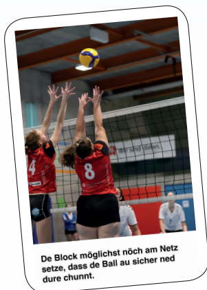
De Block möglicst nöch am Netz setze, dass de Ball au sicher ned dure chunnt.