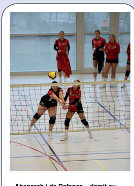
Absprach i de Defence – damit au sicher öpper de Ball berührt.