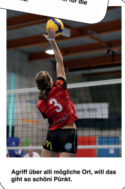
Agriff über alli mögliche Ort, will das geht so schöni Punkt.