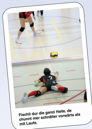
Fischli dur die ganze Halle, de chunnt mer schnäller vorwärts als mit Laufe.