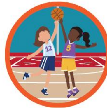
Competition with teams from your area