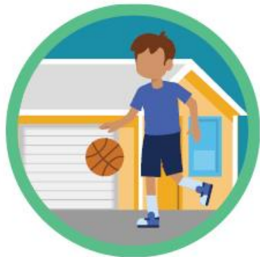
Skill-building drills at home