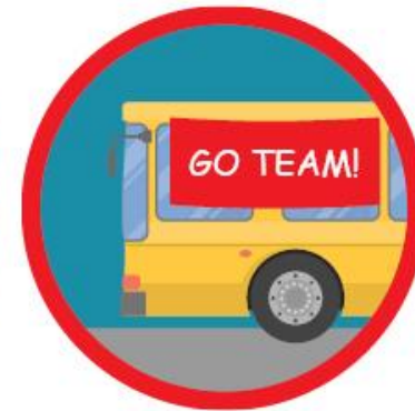
Full competition from different areas